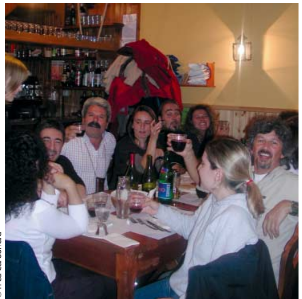
Cena alla malga

cisioni da prendere, in serata arriviamo alla riconferma unanime di questo Direttivo, che ha lavorato sodo e, con pochissime variazioni, alla riconferma di tutti i coordinatori regionali; e questo qualcosa significa, anche perché dai soci è venuto un segnale chiarissimo, con la riconferma all'unanimità un po' dovunque dei coordinatori uscenti. Segno che i soci si sentono rappresentati, e bene, da questo team che ha saputo condurre l'AI-GAE fino al punto in cui si trova oggi. Il direttivo di Edolo sarà ricordato anche per aver trovato una sede operativa all'Associazione, levandoci finalmente scatoloni di riviste