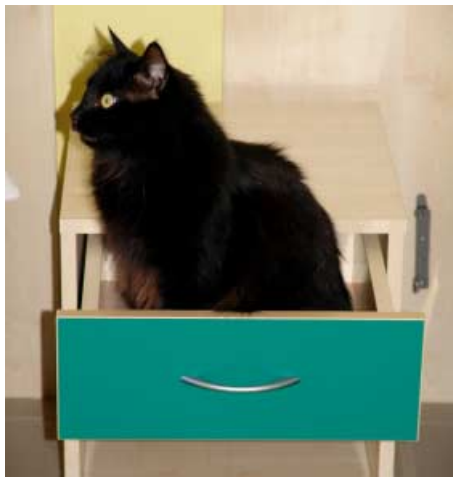
Lozzo, il gatto viaggiatore nel cassetto del comodino

Emergiamo dalle sempiterni nebbie della Padania per ritrovarci di nuovo insieme, dopo un anno, sotto il cielo