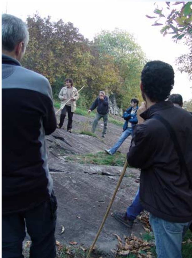
Visita guidata alle Foppe di Nadro

to' sull'area di 8.000.000 di presenze, dovute all'effetto di trascinarsi del Cammino; dati che, da soli, rappresentano il 20% degli arrivi in Spagna e che hanno spinto le autorità spagnole a dichiarare il Cammino "questione di Stato". Ci conforta pensare che i dati della Via Francigena, che con grandi sforzi stiamo cercando di ripristinare, sono pari a quelli del Cammino di 20 anni fa; sviluppare una cultura del cammino, formare e informare (gli uffici di promozione che si trovano sulla Via, in generale non ne sanno nulla) trasmettere agli amministratori informazioni sul potenziale economico del cammino. «Sono convinto - conclude Conte - che un percorso come la Via Francigena potrebbe cambiare radicalmente il modo di camminare in Italia, ma dobbiamo avere la consapevolezza che se non si collabora tutti, soprattutto noi, gli